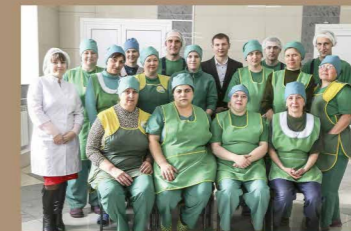
Команда людей, фасующих природу в удобную для вас упаковку.

«Мы рады помочь нашим клиентам при оформлении заказов, и в вопросах, связанных с сертификацией и применением всего ассортимента выпускаемой нами продукции.»