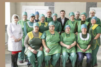
Команда людей, фасующих природу в удобную для вас упаковку.

«Мы рады помочь нашим клиентам при оформлении заказов, и в вопросах, связанных с сертификацией и применением всего ассортимента выпускаемой нами продукции.»